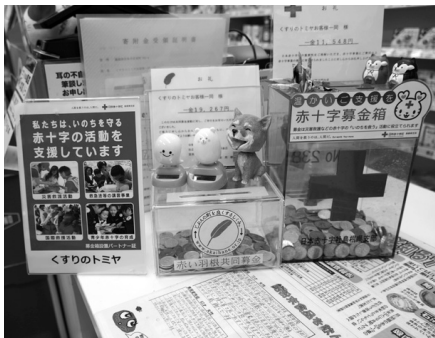
募金箱設置の様子 (くすりのトミヤ様)

今年度も、10月1日から全国一斉に「赤い羽根共同募金運動」が始まり、安来市内でも、民生児童委員協議会や、地区社協、自治会、学校、保育所、事業所などたくさんの方々に協力をしていただき、多くの募金が集まりました。募金は、令和5年度にその多くが本会へ配分され、本会の事業や、本会を通じてみなさんの地域で活動されている団体等の活動費として使われています。左記を参照ください。 また、募金の使い道などは、島根県共同募金会のホームページでも確認いただけますので、ご覧ください。（ハネツトで検索ください） みなさんのご協力に対し、心よりお礼申し上げます。