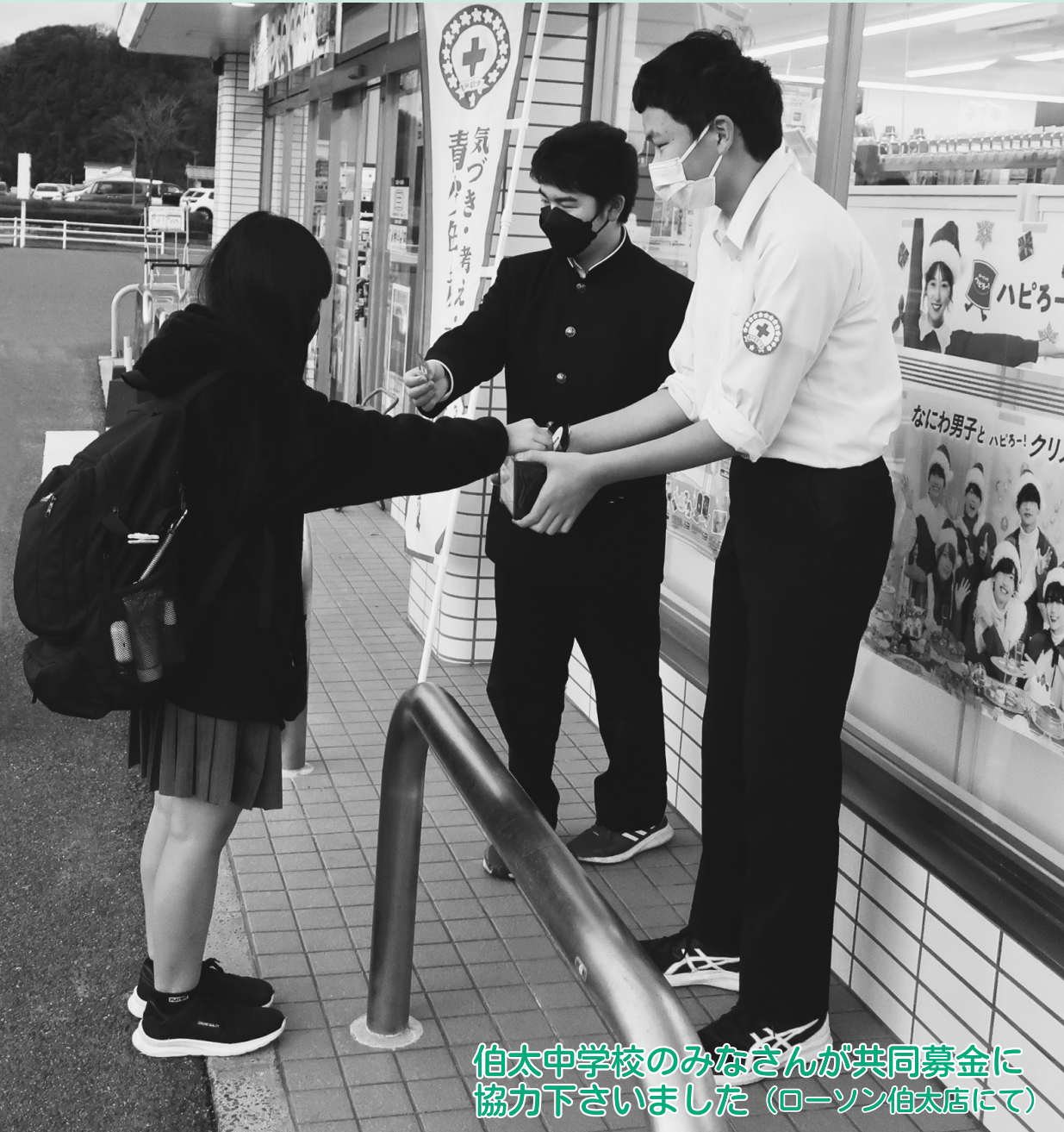
伯太中学校のみなさんが共同募金に 協力下さいました (ローソン伯太店にて)