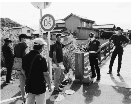
十神のまちを点検

十神地区は、かつて玉鋼の積出港等として栄えた地であり、あらためて地域の文化資源が豊富であることや、一帯が低地であり、水害の危険性が高いことなど、一同共有することが出来、今後のまちづくりのヒントとなったようです。