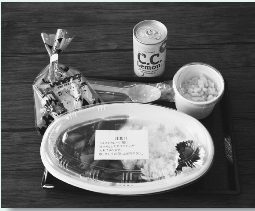
きないや食堂のカレーです

さらに、コロナ禍の終息が見えてきたことで、新たな食堂が次々誕生していますので、紹介します。